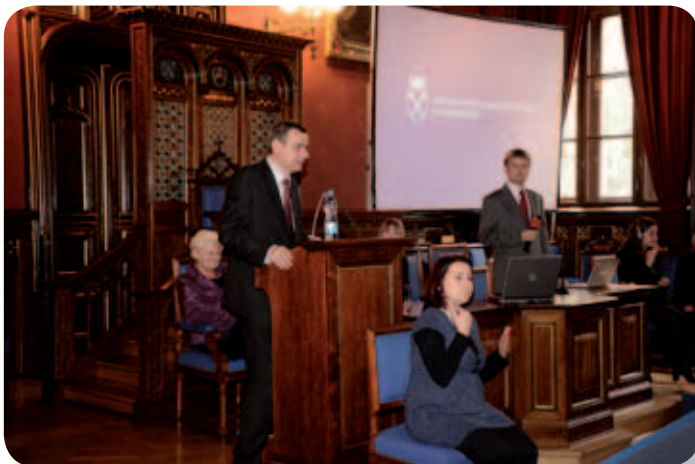
Zdj. 3. Minister Paweł Wypych podczas przemówienia