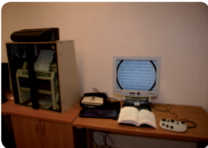
Zdj. 1. Drukarka brajlowska, notatnik brajlowski Braille SENSE i powiększalnik