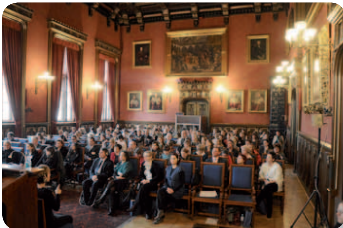
Zdj. 5. Uczestnicy konferencji w Auli Collegium Novum UJ

Prezentacje w ramach powyższych tematów odzwierciedlały zakres tematyczny szkoleń dla kadry akademickiej i administracji publicznej wypracowanych podczas projektu DARE.